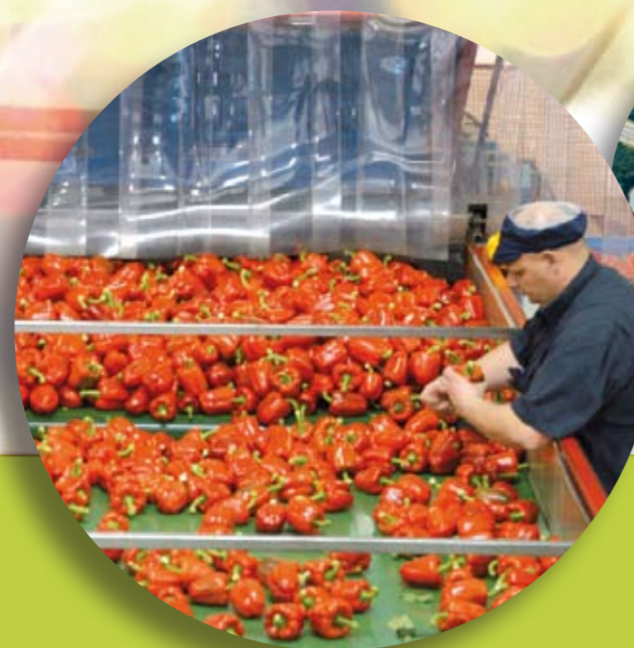
Dit is een publicatie van partners in Greenport Venlo: de gemeenten Venlo, Horst aan de Maas, Maasbree en Sevenum, de Provincie Limburg, Veiling ZON, Flora Holland en de Versnellingsagenda. Deze pagina zal enkele keren per jaar verschijnen. Voor meer informatie kunt u terecht bij de genoemde gemeente of op www.greenportvenlo.nl

Projectpartners en financiers van het ICGV zijn de Universiteit Maastricht, Universiteit Wageningen, zorgverzekeraar VGZ, Nunhems Zaden, de LLTB, de gemeenten Venlo en Horst aan de Maas. Het ICGV (www.icgv.nl) is gevestigd in Horst.